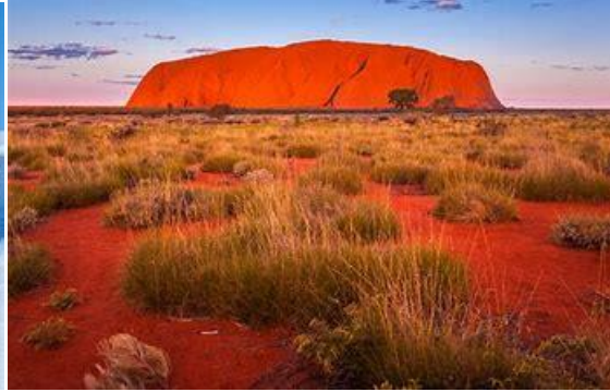
Australie (Ayers Rock- désert de l'Outback) n°6