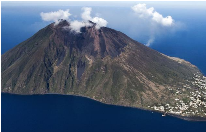
Volcan : le Stromboli (Iles éoliennes-Italie) n°7